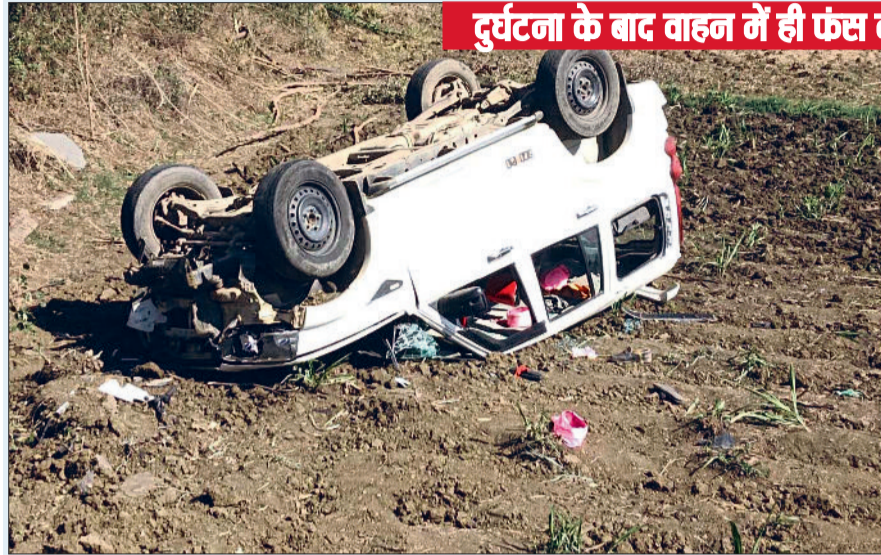
दुर्घटना के बाद वाहन में ही फंस कर रह गए

कवर्धा कोतवाली क्षेत्र से गुजरने वाले नेशनल हाईवे 30 में एक बार फिर भीषण सड़क हादसा सामने आया है। इस सड़क हादसे में जहां कार सवार एक ग्रामीण की ईलाज के दौरान मौत हो गई वहीं 3 अन्य ग्रामीण घायल बताए जा रहे हैं। जिन्हें घटना के बाद जिला चिकित्सालय में भर्ती कराया गया है। प्राप्त जानकारी के अनुसार बुधवार-गुरुवार की दरमियानी रात कवर्धा कोतवाली क्षेत्र से गुजरने वाले नेशनल हाईवे से होते हुए ग्राम छांटा-मड़मड़ा के निवासी कुछ ग्रामीण अपनी स्कार्पियो वाहन में सवार होकर कवर्धा होते हुए वापस अपने गांव जा रहे थे। बताया जाता है इसी दौरान रात करीब डेढ़ बजे के आसपास ग्रामीणों की तेज रफतार स्कार्पियो वाहन अनियंत्रित होकर ग्राम